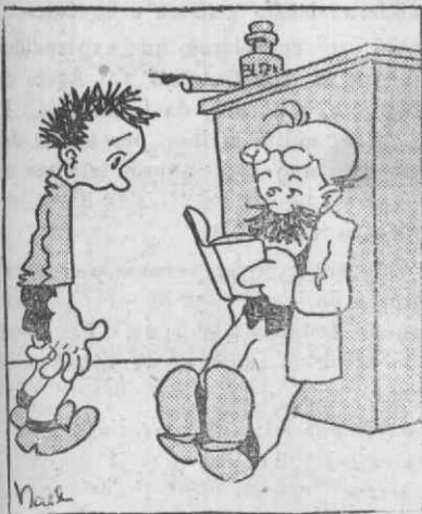
— O que quere dizer que Carlos XII era autocrático? — Que era solteiro, sr. professor.