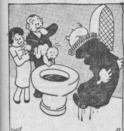
O baptismo do filho dum campeão de nataçào.

Seguiu pelas 13 horas para Agueda a fim de visitar a Escola Central de Sargentos, e depois para Viseu.