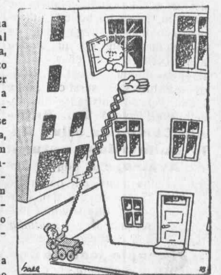
A ultima invenção para os organistas.

«A autora foi justamente castigada pelo pai, não como mulher, mas como filha. Era assim que se fazia antigamente e o mundo andava melhor.» Honra ao juiz que tal sentença deu!