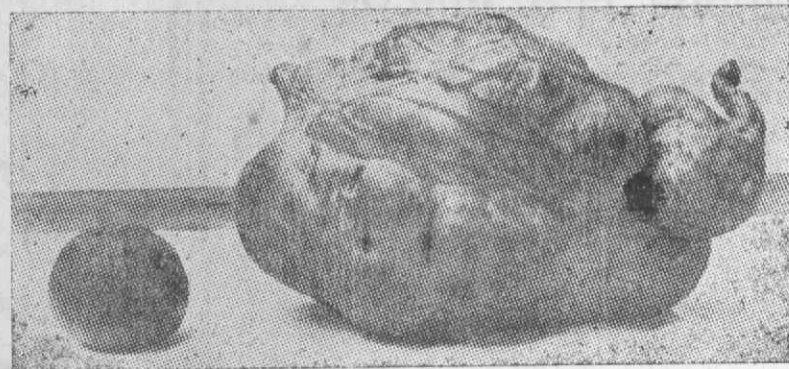
Ao lado do exemplar: uma laranja estabelece a proporção