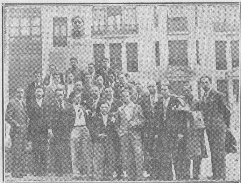
Os excursionistas da Fábrica Ateleuta junto do monumento de Camões, na Praça de Portugal, em Vigo