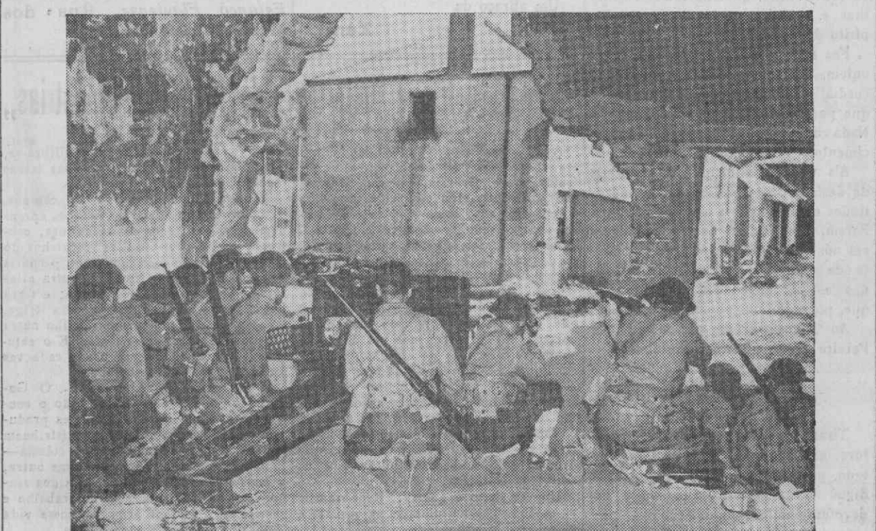
UM CANHÃO ANTI-TANK ABRINDO CAMINHO PARA UM AVANÇO DUM PEQUENO DESTACAMENTO DE INFANTARIA NORTE-AMERICANO.