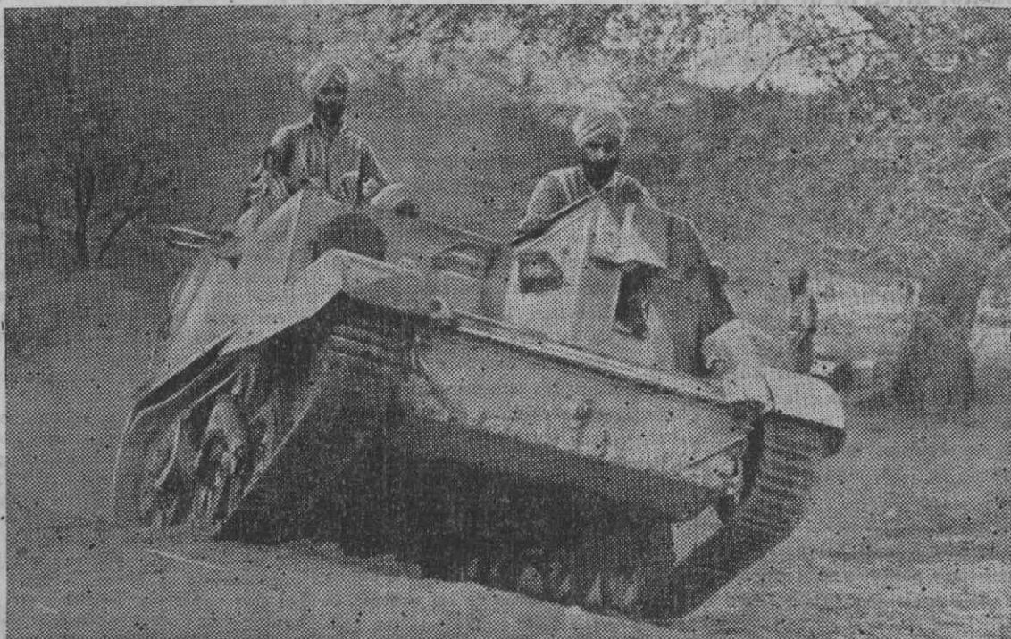
INDIFERENTE ÀS LUTAS POLÍTICAS, OS MUNDOS E ESPECIALMENTE OS MUÇULMANOS, CUJO ESPÍRITO BÉLICO É BEM CONHECIDO, LUTAM PELA CAUSA BRITANICA