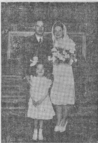
OS NOIVOS DEPOIS DA CERIMÓNIA