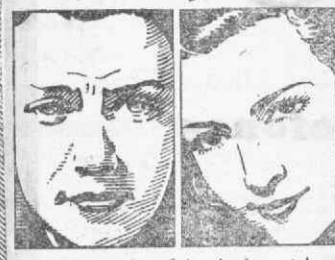
Os últimos benefícios da dermatologia moderna, agora no mais simples tratamento de beleza, em sua casa

Pareça cada manhã mais jovem do que na véspera!