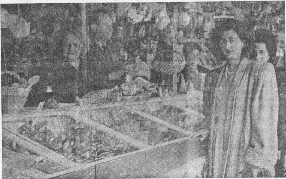
“Stand,” da CASA DOS BORDADOS e Crochets das Ilhas E. F. N.

MILHARES DE ARTIGOS REGIONAIS — QUÁSI DADOS