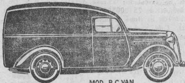
MOD. P. C. VAN