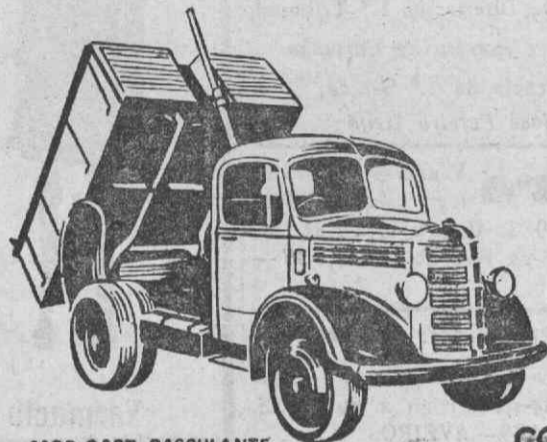
MOD. OSST. BASCULANTE

Desde o P. C. Van, a nova unidade BEDFORD para transportes ligeiros de 600 kg. até ao camião mais pesado e ao tractor BEDFORD Scammell para atrelados e semi-atrelados para carga de 10.000 kg. existem modelos especialmente fabricados para cada fim.