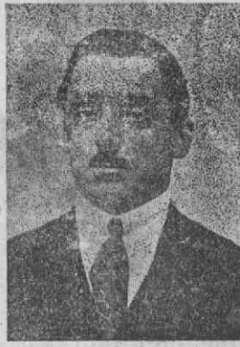
Virgilio Alves Condêssio Fábrica Cerâmica de Oliveira do Bairro