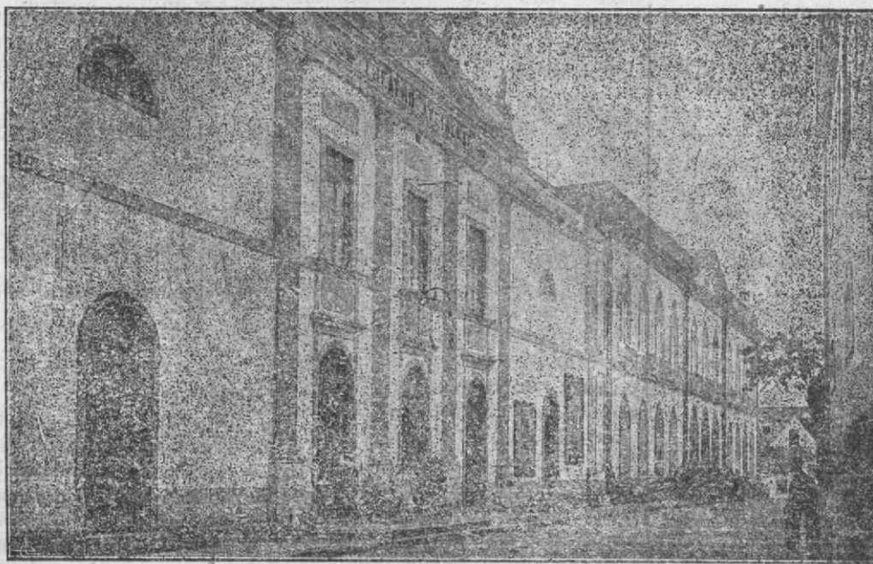
Aveiro—A' direita o edificio do liceu onde se realisam as sessões do Congresso