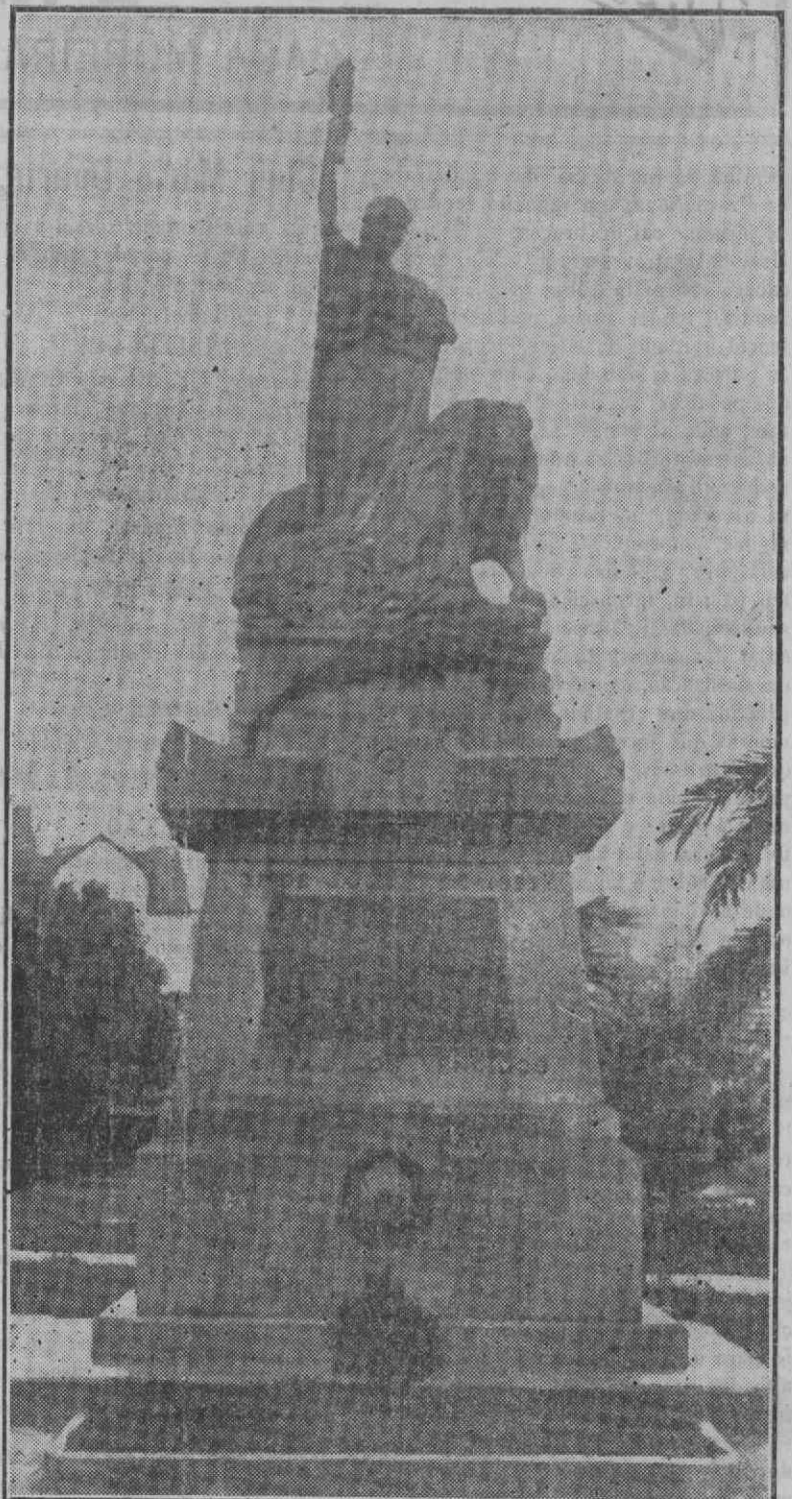
NO PRADO DO REPOUSO — O TUMULO DOS QUE PERDERAM A VIDA NA MANHÃ SANGRENTO, CUJO ANIVERSÁRIO SE COMEMORA

—E o Chagas? —Vai ser sóto imediatamente, assegurou-me ele. E das primeiras coisas que o Governo Provisório vai fazer. Não descanço enquanto não o vir cá fora.