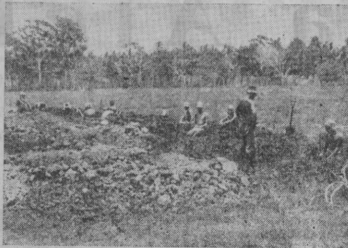
PRISIONEIRO JAPONÊS CAPTURADO EM COMBATE NAS ILHAS DE SALOMÃO TRABALHAM NA ABERTURA DE FOSOS PARA CONDUCTAS

as funções de 2. o comandante de Infantaria 10, conta nesta cidade inúmeras simpatias.