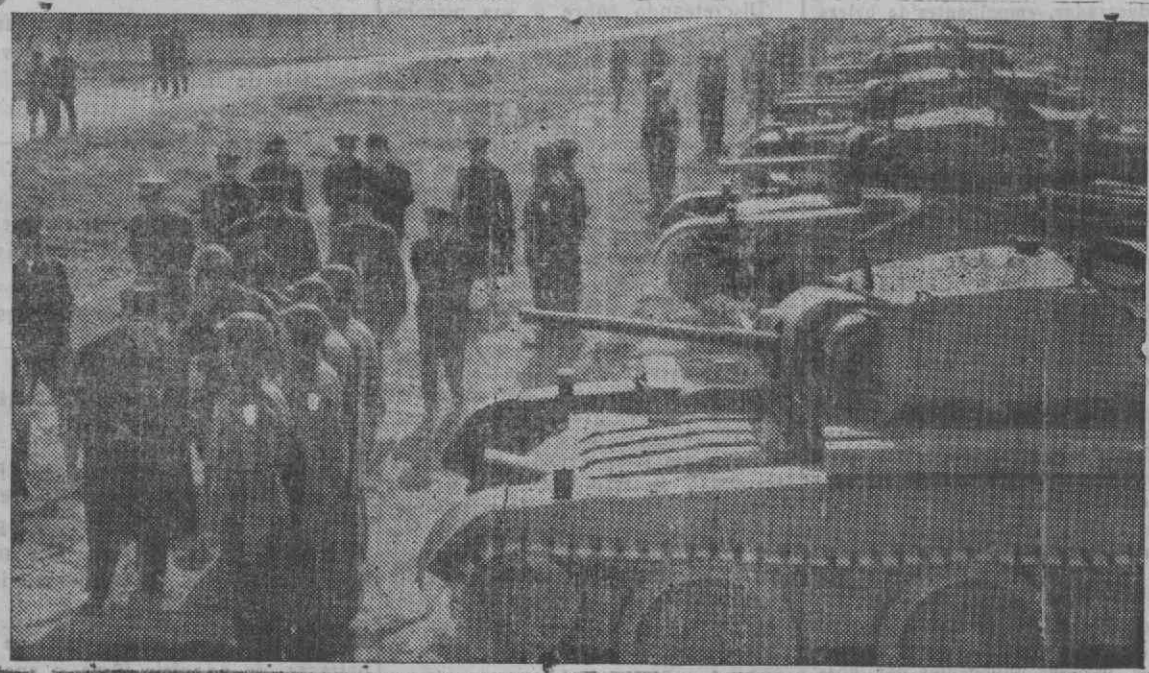
CHURCHILL E O GENERAL MARSHALL DEPOIS DE INSPECIONAREM UMA DIVISÃO MOTORISADA, CONFERENCIAM SOBRE A SEGUNDA FRENTE