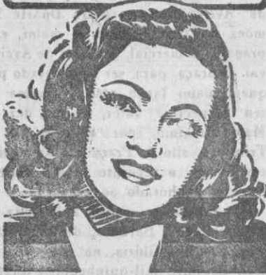
Dando-vos uma tez aveludada transparente, com um grão de pele mais fino e mais macio.

Eu posso aumentar A SUA BELEZA de maneira surpreendente EM 3 DIAS!