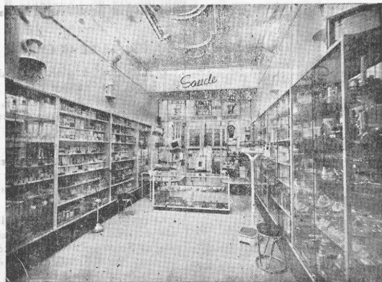
Sala de espera

E' a este modelar estabelecimento de linhas modernas, onde a fama conquistou a confiança, que recorrem todos aqueles a quem a dor faz sofrer e precisar das medicinas.