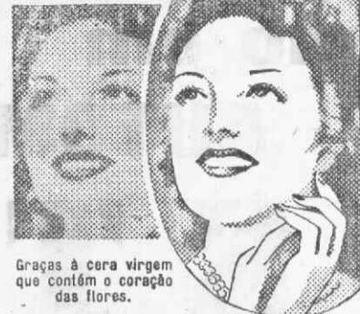
Graças à cera virgem que contém o coração das flores.

É no coração das flores raras que crescem no Côte d'Azur que os especialistas de beleza descobriram uma extraordinária cera virgem para embelezar a epiderme. Destilada e vendida sob a forma prática dum creme e sob o nome de Cire Aseptine, ela tem realmente sobre a tez um poder mágico. De manhã e à noite, aplique um pouco desta Cire Aseptine e veja como a pele, a mais estragada pelas intempéries ou pelo sol, se renova literalmente porque as células da pele "queimada" dão lugar a células novas, todas brancas e admiravelmente suaves ao tacto. A maior parte das vezes 3 dias são suficientes para aclarar a tez de um ou dois tons e para a amaciar. Desde a primeira aplicação, a transformação é surpreendente: a tez começa a tomar aquela aivura romântica à qual nenhum homem pode resistir. Os pontos negros tão feios e os poros dilatados apagam-se a olhos vistos e mesmo as sardas acabam por desaparecer. Empregue a Cire Aseptine igualmente sobre os ombros, o pescoço, os braços e as mãos. Cire Aseptine nas perfumarias e farmácias.