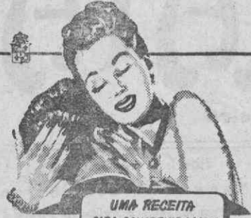
UMA RECEITA PARA CONSERVAR O AMOR DO HOMEM QUE A AMA